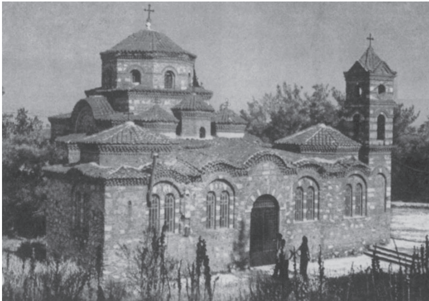
Ο Ιερός Ναός Αγίου Νικολάου Ακροπόλεως

Η διακόσμησή των και ο χαριέστατος ρυθμός στις πλευρές των εξωτερικών τοίχων του ναού είναι όμοια με τους ναούς των Δώδεκα Αποστόλων και της Αγίας Αικατερίνης της Θεσσαλονίκης. Αυτά όλα «πείθουσι ότι ο ναός αυτός των Σερρών, ήτο περικαλλές μνημείον του ΙΑ αιώνος, ει μη του Ι».