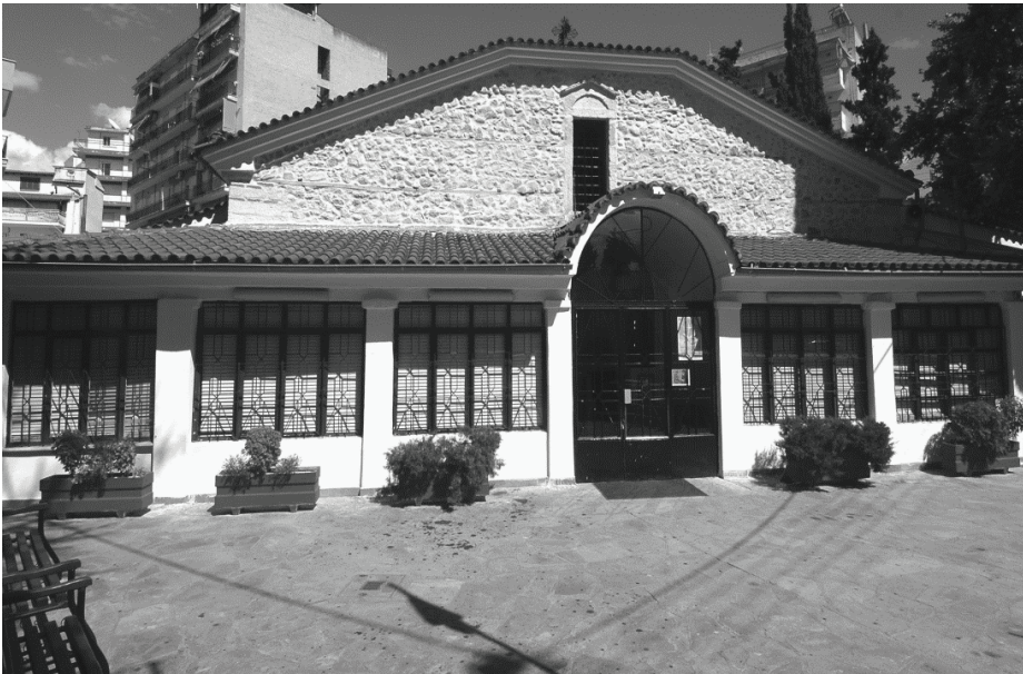
Ο Ιερός Ναός Αγίων Μαρίνης και Αντωνίου

Οι εσωτερικές διαστάσεις του ναού είναι 20,50X12,20 μ. και οι εξωτερικές με τα προσκτίσματα του Αγίου Φανουρίου 22,20X21 μ. Είναι τρίκλιτη βασιλική