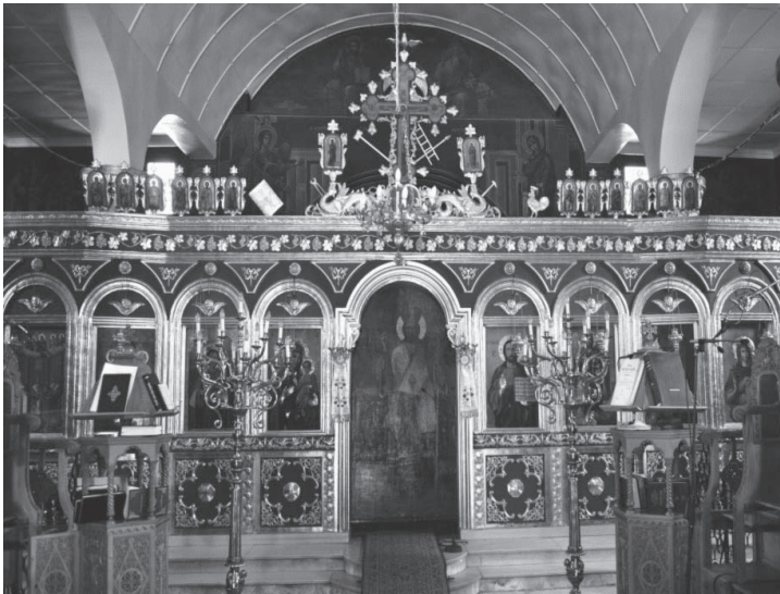
Ο Ιερός Ναός Αγίου Παντελεήμονος

στο αριστερό προσκυνητάρι για να σταματήσει η χολέρα που μάστιζε την πόλη.