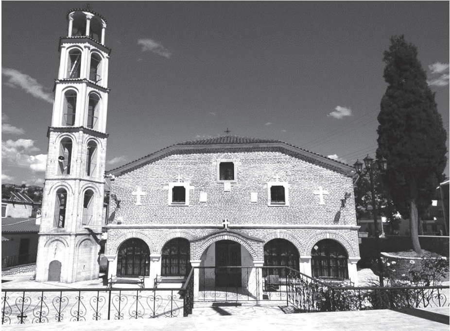
Ο Ιερός Ναός Αγίων Αναργύρων