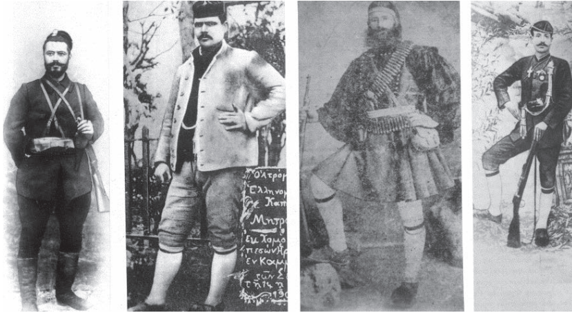
Οπλαρχηγοί του Μακεδονικού Αγώνα

Δεν υπήρχε συστηματική άμυνα στις Σέρρες προ του 1905. Ο πρόξενος Στουρνάρας, λόγω της πλειονότητας του ελληνικού πληθυσμού, θεωρούσε περιττή την ένοπλη άμυνα. Οι πολλές όμως δολοφονίες αθώων Ελλήνων και η προσχώρηση χωριών στη βουλγαρική Εξαρχία προκάλεσαν τη σύσταση ενός