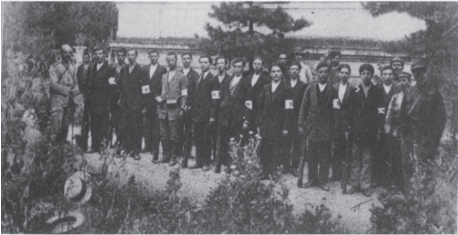
Οι εθελοντές του λόχου πολιτοφυλακής άμυνας κατά των Βουλγάρων από 21 έως 27 Ιουνίου 1913 στις Σέρρες

Συγκρότησαν διάφορες επιτροπές για να αντιμετωπίσουν την έκτακτη εκείνη κατάσταση που βρίσκονταν οι κάτοικοι της πόλεως, μεταξύ ζωής και θανάτου. Οι σπουδαιότερες επιτροπές ήταν: α) Η επιτροπή άμυνας, β) η επιτροπή πολεμικού υλικού και γ) η επιτροπή επισιτισμού. Οι επιτροπές αυτές έδρασαν αμέσως.