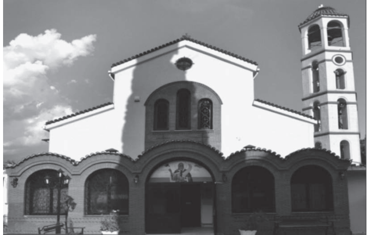
Ο Ιερός Ναός Προφήτη Ηλία Σερρών

Από τα αξιόλογα έργα ξυλογλυπτικής τέχνης του ναού διακρίνεται το χειροποίητο τέμπλο 70 τ.μ. περίπου (13,5X5,20 μ.) με σπάνιες καλλιτεχνικές θαυμάσιες πρωτότυπες ξυλόγλυπτες παραστάσεις. Έχει βαθιές αυτούσιες τομές χωρίς πρόσθετα κολλημένα τεμάχια. Είναι αριστούργημα τέχνης.