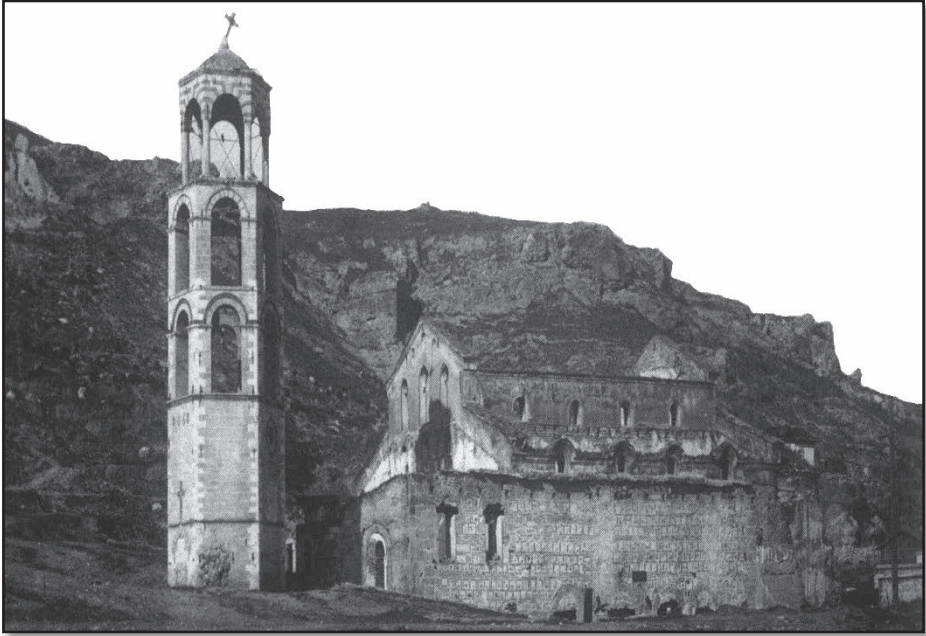
Ο πυρπολημένος από τους Βουλγάρους το 1913 περικαλλής παλιός μητροπολιτικός Ναός των Αγίων Θεοδώρων Σερρών με το παλαιό κωδωνοστάσιο

Το 1852 επιδιορθώθηκαν οι ζημιές που υπέστη ο ναός από την πυρκαγιά του 1849, ήτοι η στέγη, το τέμπλο, οι αγιογραφίες και οι κολόνες που ράγιζαν.