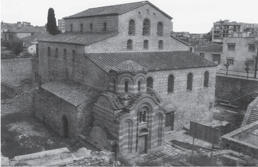
Ο παλιός μητροπολιτικός Ναός των Αγίων Θεοδώρων ανακαινισμένος