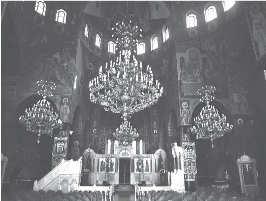
Μητροπολιτικός Ναός των Παμμεγίστων Ταξιαρχών

Για την αποπεράτωση του ναού επινοήθηκαν πολλοί τρόποι συγκεντρώσεως χρημάτων από δωρεές κινητής και ακινήτου περιουσίας, από προσφορές των κρατικών και δημοτικών υπηρεσιών, οργανισμών, τραπεζών, συλλόγων, από οργανώσεις συναυλιών, λαχειοφόρων κληρώσεων, εκθέσεων εργασιών, διανομής κουμπάρδων κατ' οίκον, αποστολής εγγράφων προς τα σχολεία και όλες τις δημόσιες του νομού Σερρών υπηρεσίες, αλλά και με παντός είδους εράνων από δραστήριες ερανικές επιτροπές. Πάντες συνέδραμον γενναία από του υστερήματός των. Δόθηκαν ακόμη 300.000 δρχ. επιχορηγήσεις από το κράτος, 800.000 δρχ. από το Δήμο Σερρών, 150.000 δρχ. από τη Νομαρχία Σερρών, 50.000 δρχ. από τις Ένοπλες Δυνάμεις και 40.000 δρχ. από τα κρατικά λαχεία.