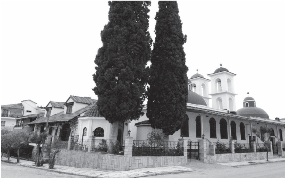
Ο Ιερός Ναός Αγίας Παρασκευής

Σε μικρή απόσταση νοτιοανατολικά του Ναού των Αγίων Θεοδώρων, στην οδό Ίωνος Δραγούμη, νυν Μητροπολίτου Κωνσταντίνου, αριθ. 32 βρίσκεται ο Ναός της Αγίας Παρασκευής.