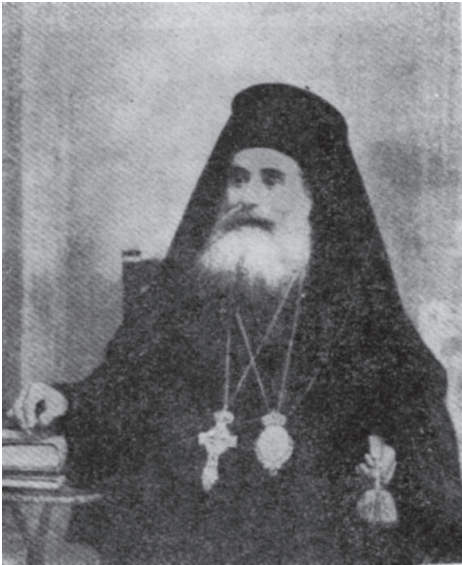
Ο μητροπολίτης Σερρών Απόστολος

Από το ημερολόγιο του μητροπολίτη Αποστόλου Χριστοδούλου (1909-1917) αποδεικνύεται ότι η τοπική Εκκλησία συνέβαλε πολύ στην απελευθέρωση των Σερρών.