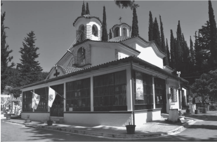
Ο Ιερός Ναός Αγίων Κωνσταντίνου και Ελένης

Ο ναός είναι λιθόκτιστος, μονόχωρος, με μεγάλο ημιθόλιο και μικρό τρούλο, καμαροσκεπής στα άκρα χωρίς νάρθηκα. Έχει φαρδείς τοίχους με πρόσθε-