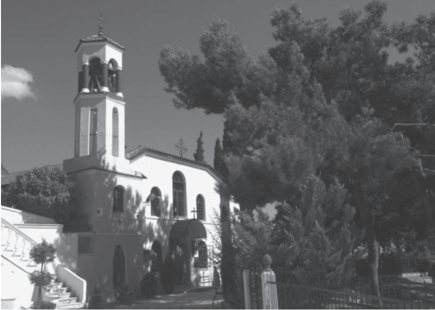
Ο Ιερός Ναός Αγίου Ιωάννου του Θεολόγου

Ο ναός είναι βασιλικού ρυθμού, τρίκλιτος με σαμαρρωτή ξύλινη τετράριχτη στέγη. Επεκτάθηκε προς δυσμάς το 1919, οπότε προστέθηκαν ξύλινοι γυ-