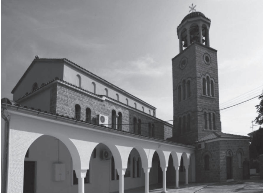
Ο Ιερός Ναός Ευαγγελίστριας

Ο ναός είναι τρίκλιτη βασιλική, αλλά έχει σχήμα σχεδόν τετράγωνο 18,30X 17,80 μ. Το πλάτος των ακριανών κλιτών είναι 4,20 μ., του δε μεσαίου 9,30 μ.