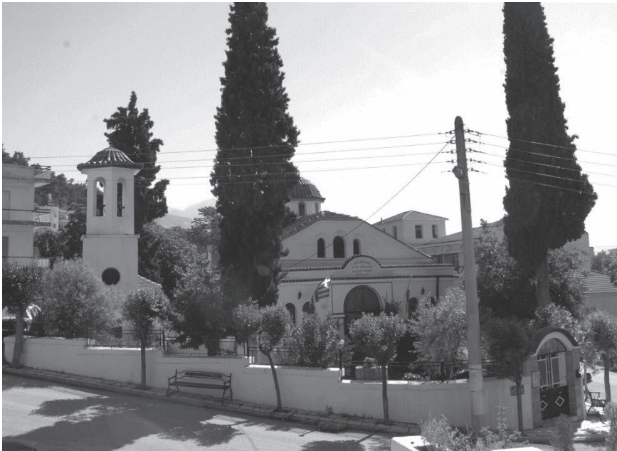
Ο Ιερός Ναός Αγίων Μηνά και Κυριακής

Ο ναός κήκε το 1913 και υπολογίστηκε η αξία του για αποζημίωση στις 2.500 χρυσές λίρες. Ο χώρος του οικοπεδοποιήθηκε και διανεμήθηκε σε ιδιώτες. Η ανοικοδόμησή του ήταν πολύ δύσκολη, διότι αρνούσανται οι ιδιοκτήτες αυτών να παραχωρήσουν τα οικοπέδα.