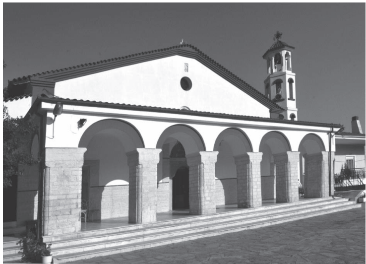
Ο Ιερός Ναός Αγίου Παντελεήμονος

Το τέμπλο από το 1935 είναι κτιστό, διακοσμημένο με γύψινες ανάγλυφες γιρλάντες κλήματος αμπέλου στην κορυφή, με διπλά τόξα γύρω από τις εικόνες και ροζέτες κάτω απ' αυτές βαμμένες με χρυσό χρώμα.