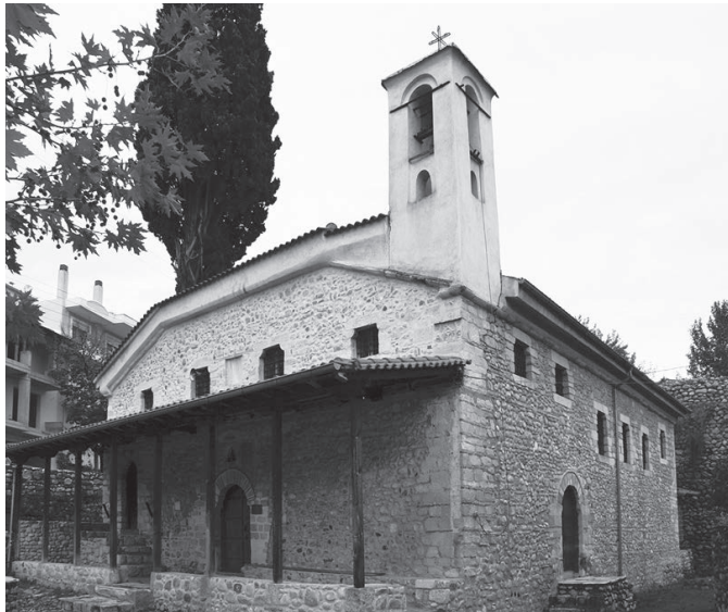
Ο Ιερός Ναός Τιμίου Ιωάννου του Προδρόμου

Ο ναός είναι βασιλική τρίκλιτη, ξυλόστεγη κεραμοσκεπής με τετράριχτη στέγη, εσωτερικών διαστάσεων 14,40X 11 μ., με πρόσθετο τον εξωνάρθηκα. Το μικρό κωδωνοστάσιο βρίσκεται στη νοτιοδυτική γωνία της στέγης του ναού. Έχει τρεις ξύλινες εισόδους και 19 παράθυρα με περιορισμένο φωτισμό. Οκτώ ξύλινες κολόνες, επενδεδυμένες με