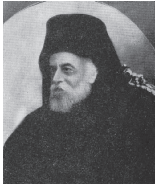
Ο μητροπολίτης Σερρών Γρηγόριος

Εθνικός και θρησκευτικός ήταν ο Μακεδονικός Αγώνας. Όσοι προσχωρούσαν στη βουλγαρική Εξαρχία χαρακτηρίζονταν Βούλγαροι. Δεν είχε σημασία ποια γλώσσα μιλούσαν, αλλά σε ποια Εκκλησία ανήκαν. Έγινε λόγος σε έγγραφο του υποπροξενείου Σερρών περί απομακρύνσεως μερικών μοναχών εκ της Ιεράς Μονής Τιμίου Προδρόμου του Μενοικέως όρους, επειδή μιλούσαν βουλγαρικά. Ο πατριάρχης και ο μητροπολίτης Σερρών δεν αποφάσισαν την εκδίωξή τους διότι η κοινή γνώμη τους χαρακτήριζε Έλληνες (Γκραικομάνους) αφού δεν προσχώρησαν στην Εξαρχία 213 .