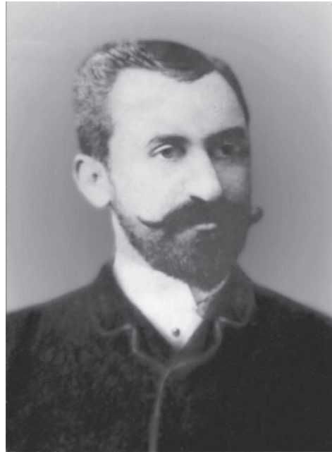
Ο Αναστάσιος Χρυσάφης

Θυσίασε τα πάντα στον αγώνα. Έλαβε μέρος σε όλες τις φάσεις του συνεργαζόμενος στενά με το ελληνικό υποπροξενείο των Σερρών. Με τον μεγαλύτερο γιο του Κωνσταντίνο στο χωριό Τζίντζος, όπου είχε κτήματα, μύησε όλους τους κατοίκους στον αγώνα και παραλάμβανε τα όπλα και τα πυρομαχικά που στέλνονταν με ιστιοφόρα στον κόλπο του Ορφανού από την ελεύθερη Ελλάδα. Τα φύλασσε στις αποθήκες του κτήματός του και τα προωθούσε στα ανταρτικά σώματα. Ήταν ο εγκέφαλος της οργάνωσης του αγώνα και προμηθευτής όπλων όλης της ανατολικής Μακεδονίας. Τούτο φαίνεται από το ιδιόγραφο υπόμνημά του, το οποίο βρέθηκε στο σπίτι της κουνιάδας του στην Αθήνα, το οποίο πήγε να παραδώσει προσωπικά στο διάδοχο Κωνσταντίνο. Πρότεινε για διπλωματικούς λόγους να αποκεντρωθεί ο Μακεδονικός Αγώνας από το ελληνικό υποπροξενείο και συνιστούσε την οργάνωση τριών ανεξαρτήτων απ' αλλήλων ανταρτικών σωμάτων υπαγομένων στις διαταγές τους στρατιωτικού κέντρου των Σερρών. Επεσήμανε τις ελλεί-