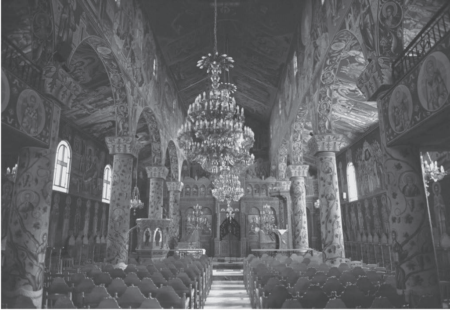
Ο Ιερός Ναός Προφήτη Ηλία Σερρών